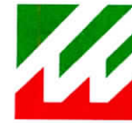
CUADRO DE ASIGNACIÓN DE PERSONAL (CAP) - EMMSA